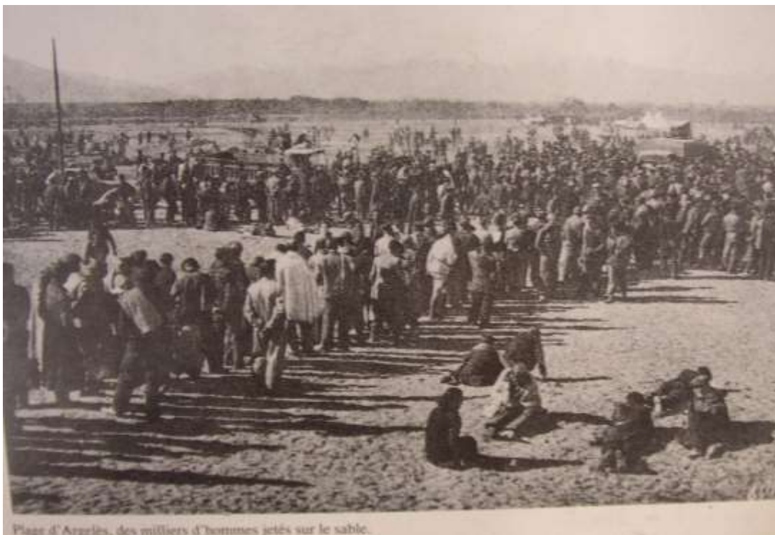
Abbildung 2: "Plage d'Argelès, des milliers d'hommes jetés sur le sable."

Das Lager in Saint-Cyprien – die „Pestbeule Frankreichs“ (Fry 1986) - bekommt von den Franzosen den offiziellen Titel „Camp de Concentration de Saint-Cyprien“, heute werden die Lager Internierungslager (Camp d’Internement) genannt. In Argelès sollen bis zu 75.000 Menschen, in Saint-Cyprien bis zu 90.000 Menschen gelebt haben. Sie hausen dicht gedrängt auf dem Sandstrand, gegen Kälte und Feuchtigkeit kaum geschützt in Holzverschlägen, notdürftig versorgt von den französischen Behörden. Im Juni 1940 z. B. erhalten sie zum Schutz gegen den feuchten Untergrund Strohmatte, die von Läusen durchsetzt sind. Bei einer Typhusepidemie im Sommer 1940 sterben mindestens 9 Menschen im Lager Saint-Cyprien und 250 Menschen im Krankenhaus St. Jean in Perpignan. Später werden Baracken auf den Sand gesetzt.