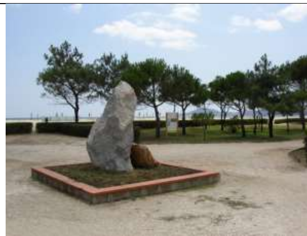
Abbildung 4: Gedenkstein in Argelès

À la Mémoire des 100.000 Républicains Espagnols internés dans le camp d'Argelès lors de la RETIRADA de février 1939.